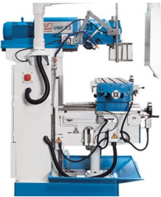
Große Ausladung und lange Verfahrswege