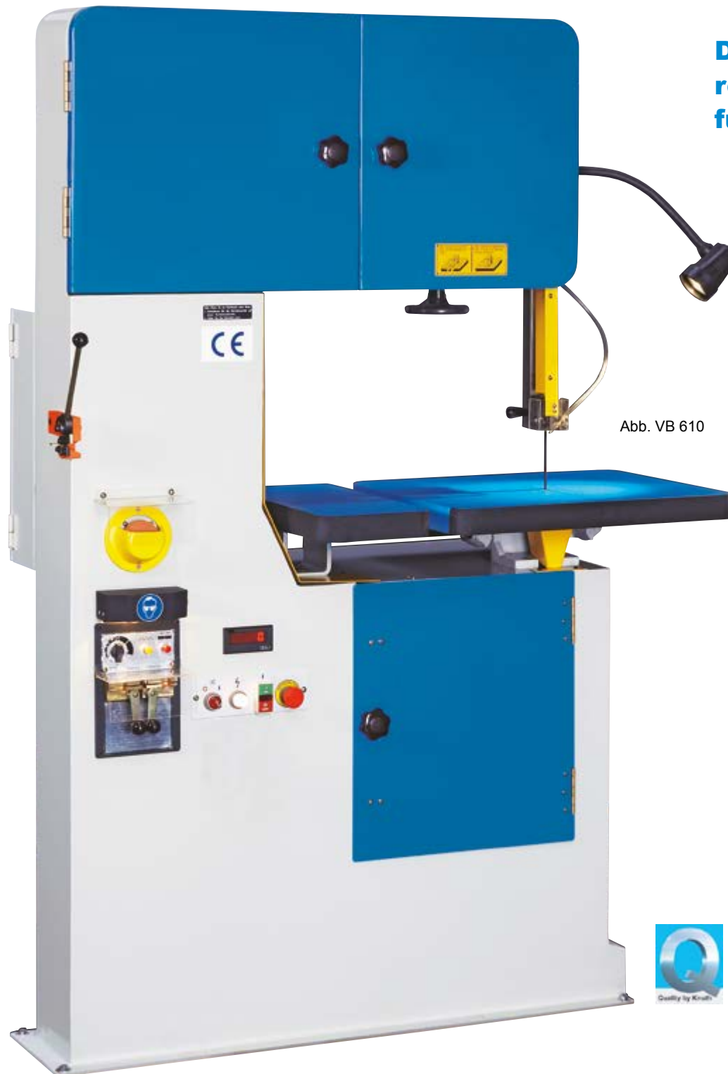
Abb. VB 610