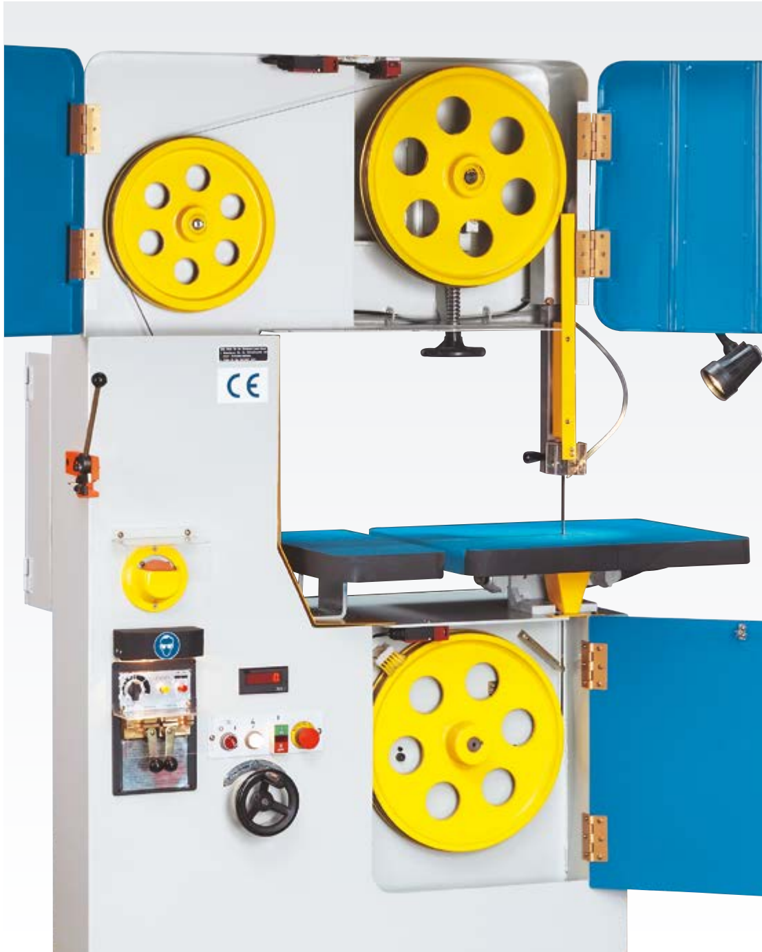
optimale Blattspannung über Handrad